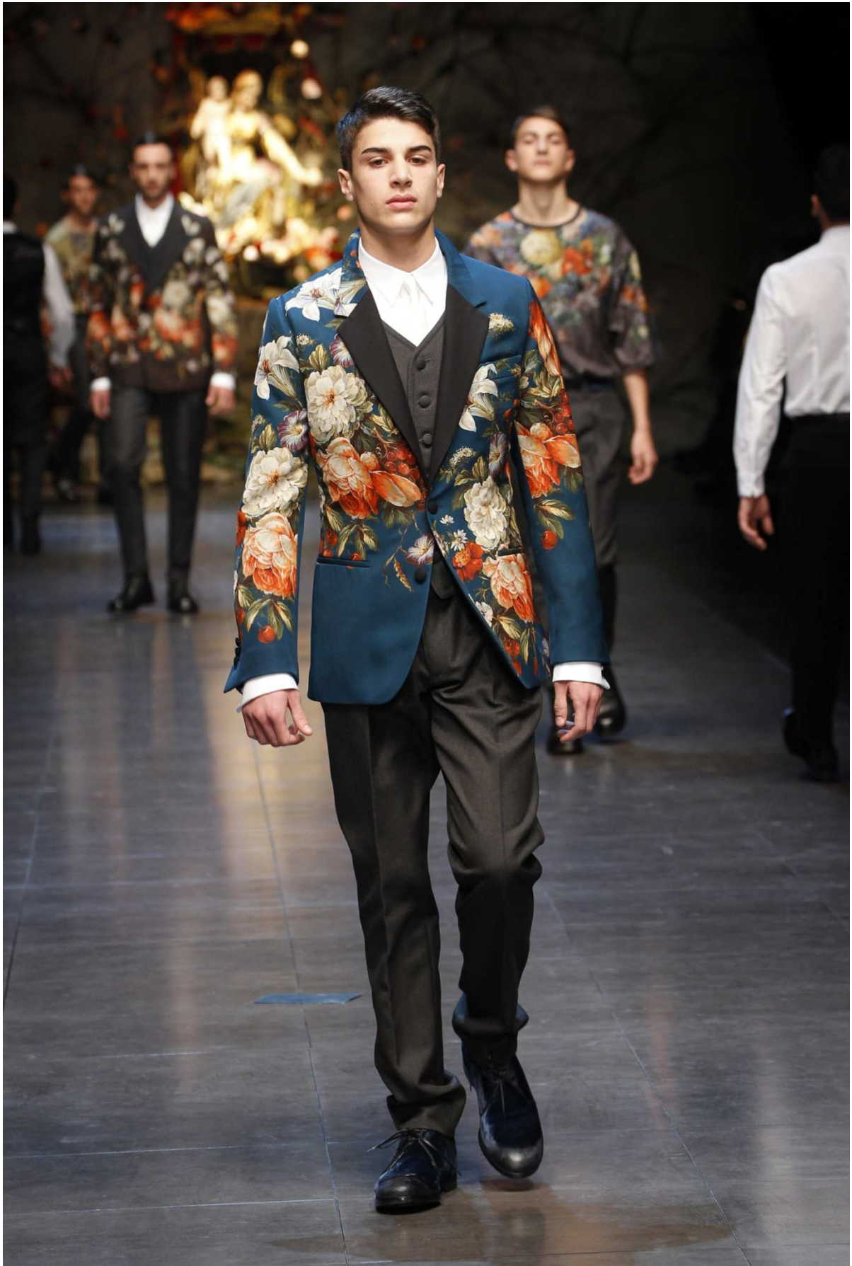
Figura 1: Dolce&Gabbana A/I 2014 men-collection