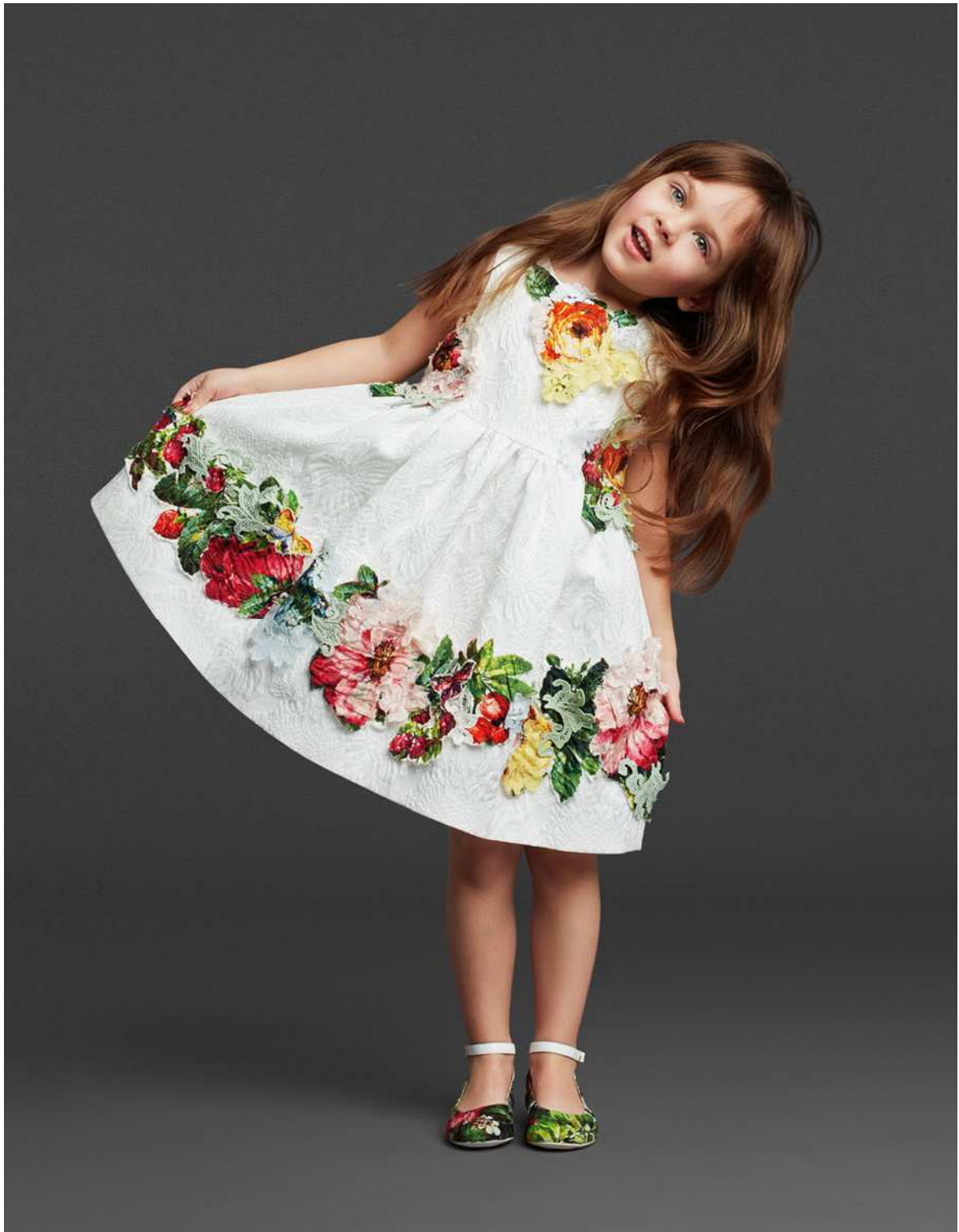
Figura 3: Dolce&Gabbana A/I 2014 kids-collection